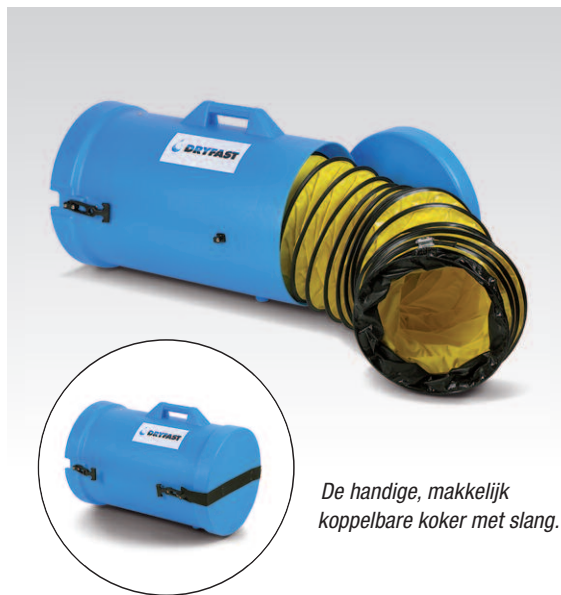
De handige, makkelijk koppelbare koker met slang.