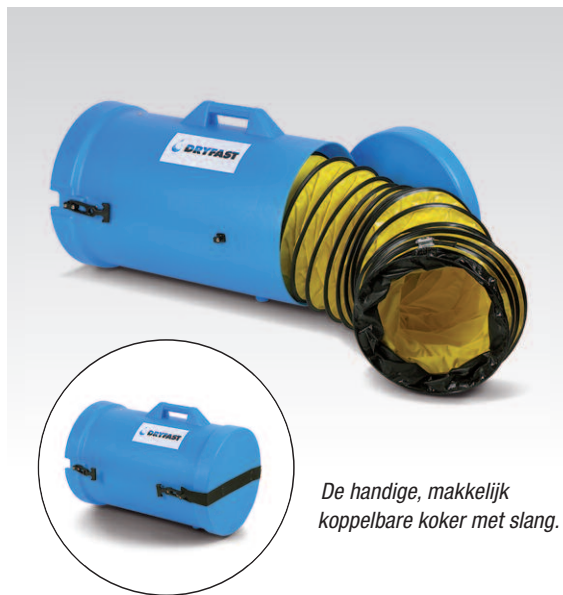
De handige, makkelijk koppelbare koker met slang.